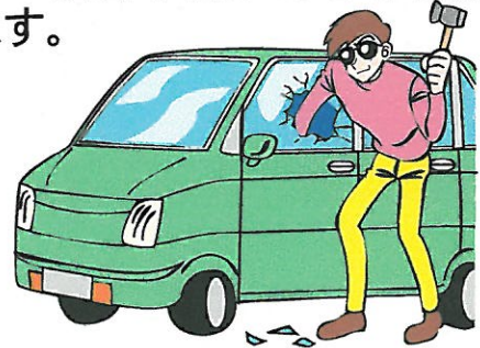
中区及び隣接区車上ねらい発生状況

犯行の時間は ほんの数分 です。 また、一晩に何件も連続に被害が発生する場合があります。