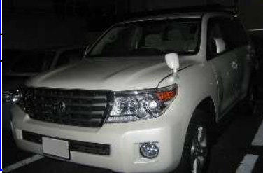
盗難後放置されたランドクルーザー