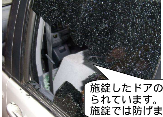
施錠したドアのガラスを割られています。施錠では防げません!!