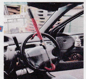
ハンドル固定装置