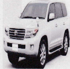
ランドクルーザー